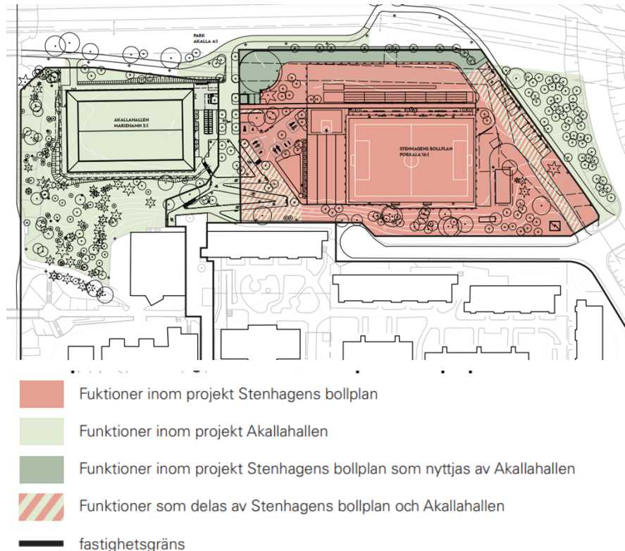
Figur 4: Situationsplan som illustrerar hur de två projekten Akallahallen och Stenhagens BP är beroende av varandra. Åtgärder inom de ljusgröna områdena ingår i Akallahallens budget.